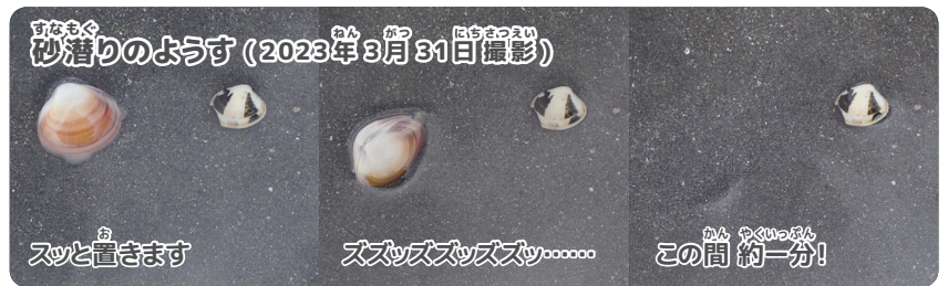
砂潜りのようす (2023年3月31日撮影)

ラスト3本目!!! 食べ比べ アサリは食料として家庭でも非常によく食べられる人気の貝で、ご存じのとおりその美味しさは折り紙つきです。よく砂を吐き調理もしやすいので、味噌汁や炊き込みご飯、酒蒸しなど様々な料理で大活躍しています。一方のシオフキは砂抜きが難しいことで知られます。茹でた後に身を取り出し、砂の多い外套膜と呼ばれる部分をしっかり水で洗って処理すれば、食べることもできますが、一般的には食用に向かない「食べられない貝」とされ、人気はイマイチです。いよいよラスト3本目、食べ比べはアサリの勝利です!